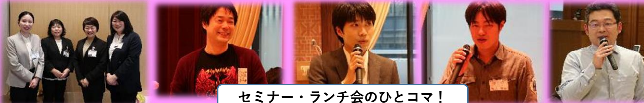
セミナー・ランチ会のひとコマ!