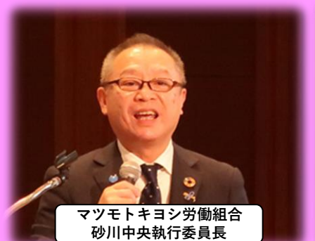
マツモトキヨシ労働組合 砂川中央執行委員長