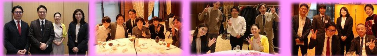
ご参加いただいた皆さま