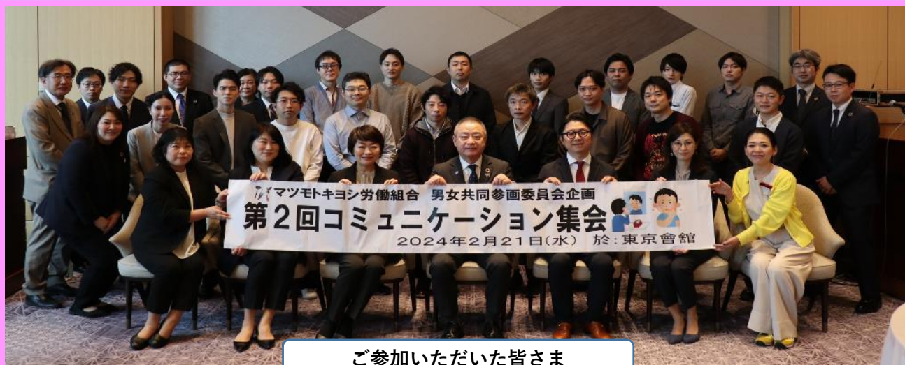
マツモトキヨシ労働組合 男女共同参画委員会企画 第2回コミュニケーション集会 2024年2月21日(水) 於:東京會館